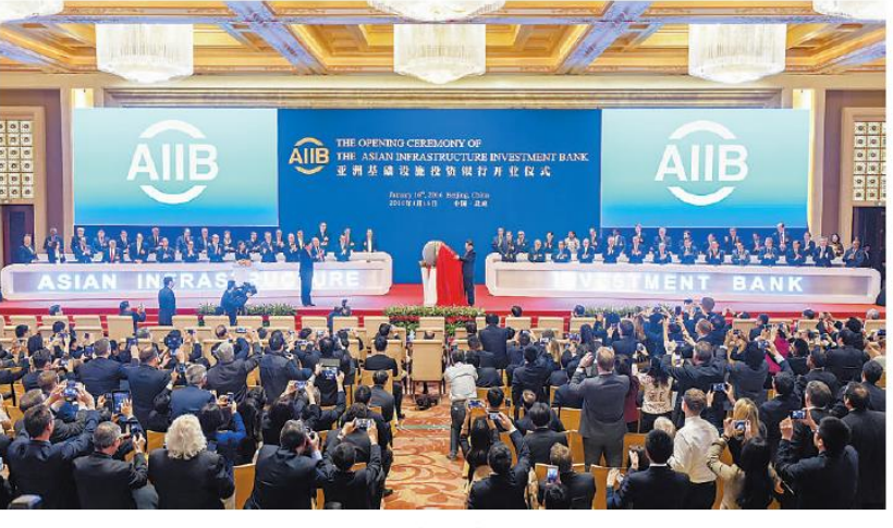
左圈:1月16日,亚洲基础设施投资银行开业仪式在北京举行。国家主席习近平出席开业仪式并致辞。 上图:1月16日,亚洲基础设施投资银行开业仪式在北京举行。国家主席习近平出席开业仪式并致辞。这是 习近平为亚投行标志物"点石成金"据篡。