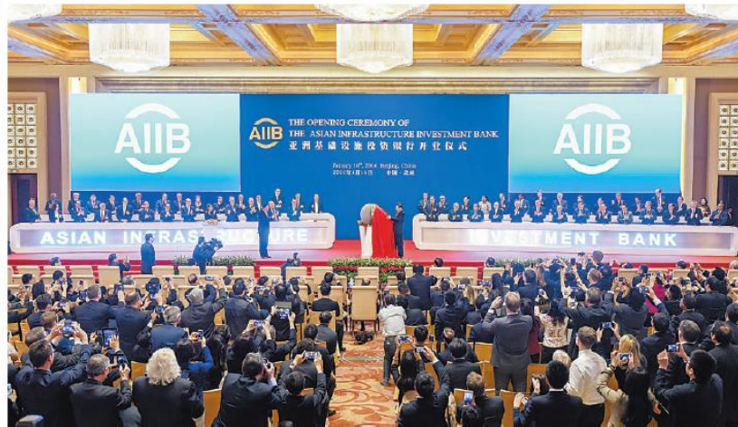
左图:1月16日,亚洲基础设施投资银行开业仪式在北京举行。国家主席习近平出席开业仪式并致辞。